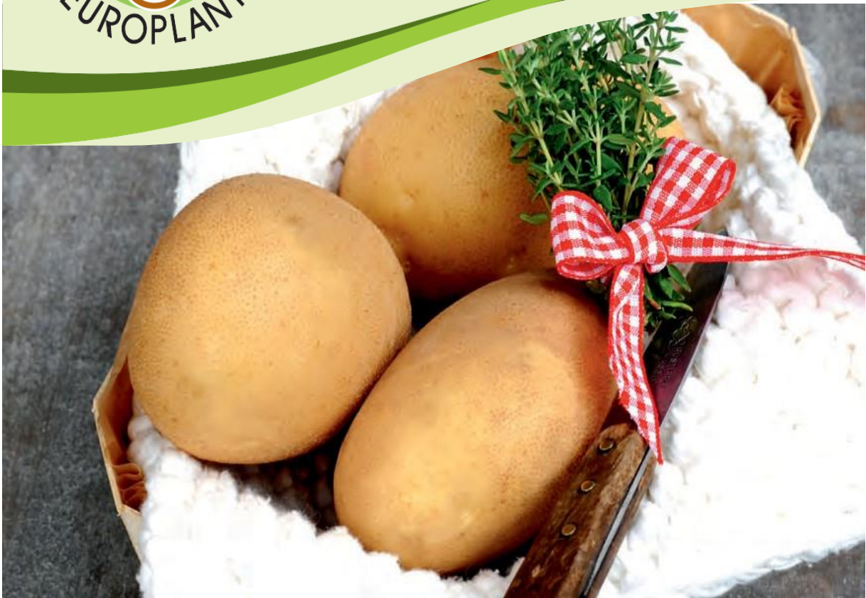
Srednje rani krompir, tipa kuvanja B